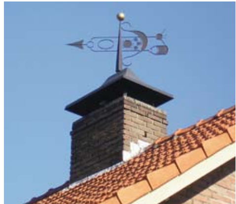
De Spoetnik en het Mir-ruimtestation in de windvaan van Huize MIR.