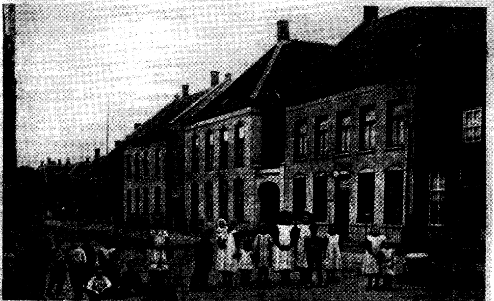
Gezicht Nieuwstraat - Gemert. 1914-15

In de tweede helft van de 16de eeuw werd de hoek Nieuwstraat-Virmundtstraat pas bebouwd. Eén der panden, mogelijk "Het Hert", was "De Keizer" waarvan in dit artikel sprake is. Wat daar nog van over was (?) ging bij de grote dorpsbrand in 1785 in vlammen op!