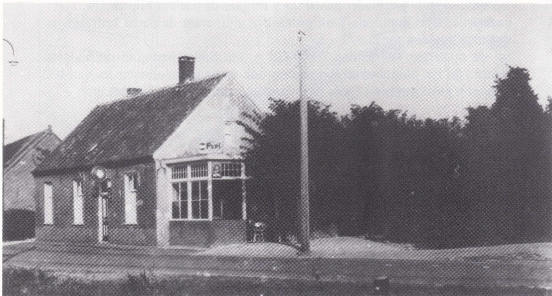
Café "De Zoete Moeder". Foto uit de jaren zestig. Geheel rechts is de achtergevel van de boerderij van Egelmeers, het voormalige "Weesgoed", nog net zichtbaar.

percelen die eigendom zijn van de H. Geestarmen toegevoegd te zijn, want de totale grootte blijkt nu 4 bunder, 89 roeden en 54 ellen te zijn. 11