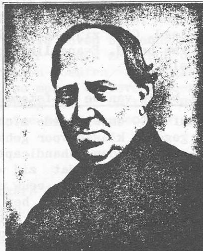
De Stichter van het Instituut voor Doofstommen. de Zeereerw. Heer Martinus van Beek.

ingebruikname op 2 oktober 1840 was het Doveninstituut te Gestel een feit.