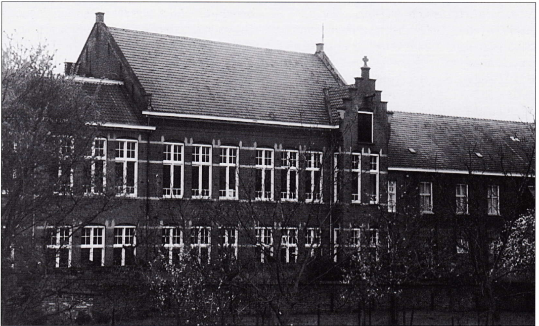
Historie van scholenbouw in beeld (1998). De hoge bouw is van 1914. Links is de schooluitbreiding uit 1933/1934, rechts de schoolbouw van 1882.