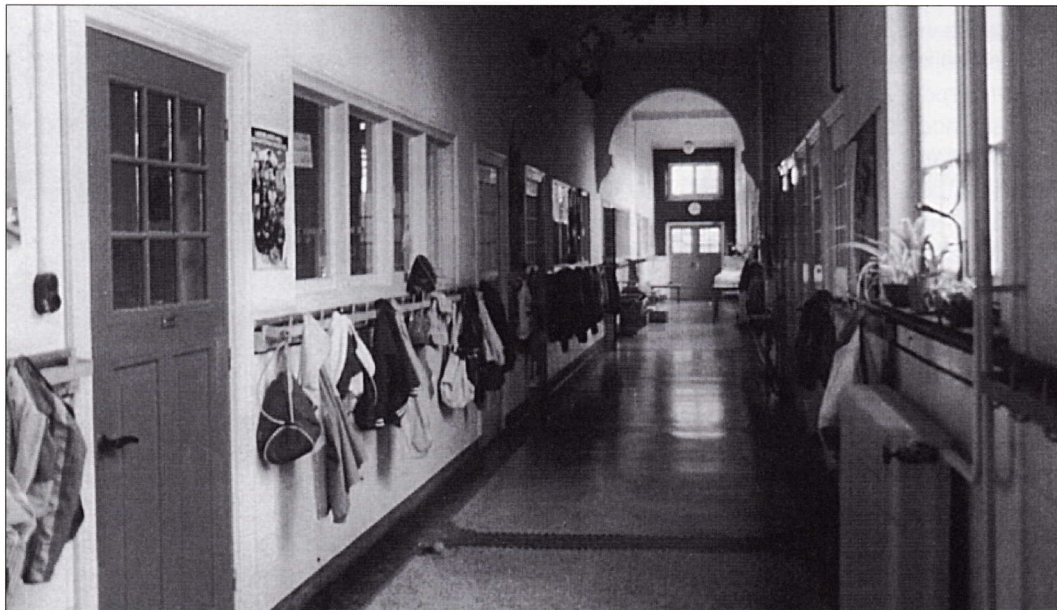
Monument van een schoolgang.