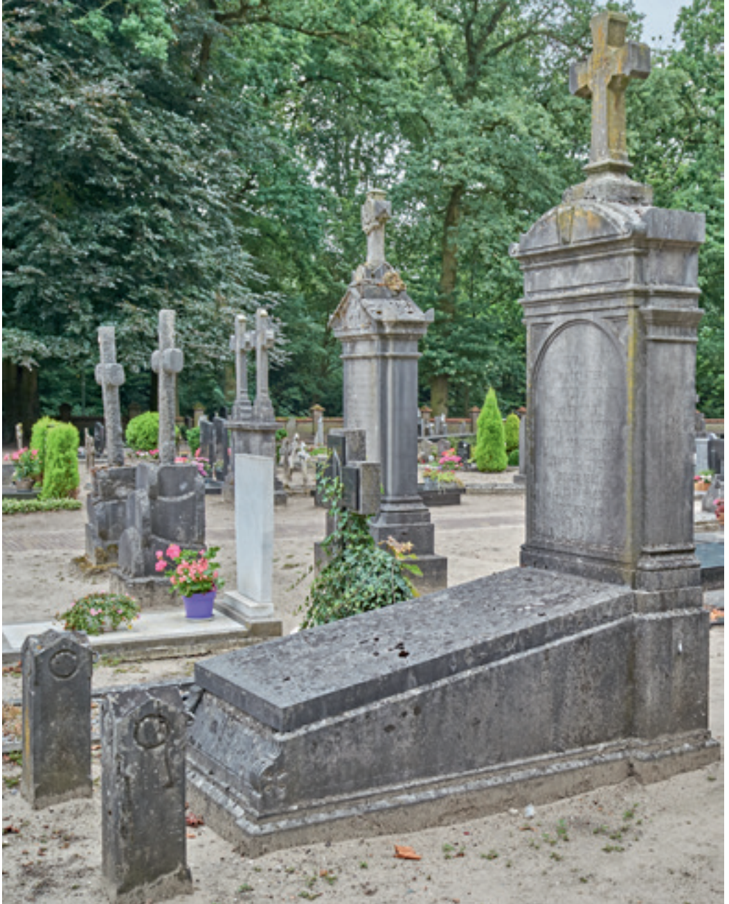
Het graf van Willem van Schijndel.