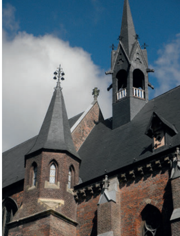
Het traptorentje waardoor de koorzolder bereikbaar was.

Het gemeentearchief? Misschien is 'het heerlijkheidsarchief' een betere naam. Dáár gaat dit verhaal over. Het archief dat aanvankelijk in één, later in twee zware kisten, hoog en droog werd bewaard op de koorzolder tussen priesterkoor en middenschip van de kerk en dat bereikbaar was via het traptorentje aan de buitenkant van het priesterkoor. De archiefkisten konden alleen met touwen van het oksaal, zoals de koorzolder ook