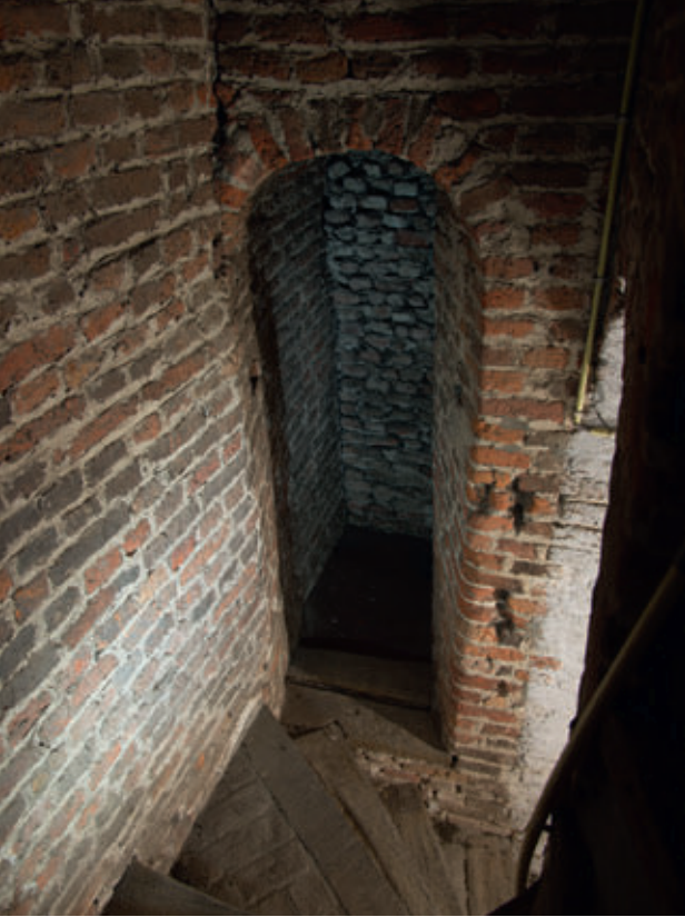
De in de negentiende eeuw dichtgemetselde gang die voorheen naar de koorzolder leidde.