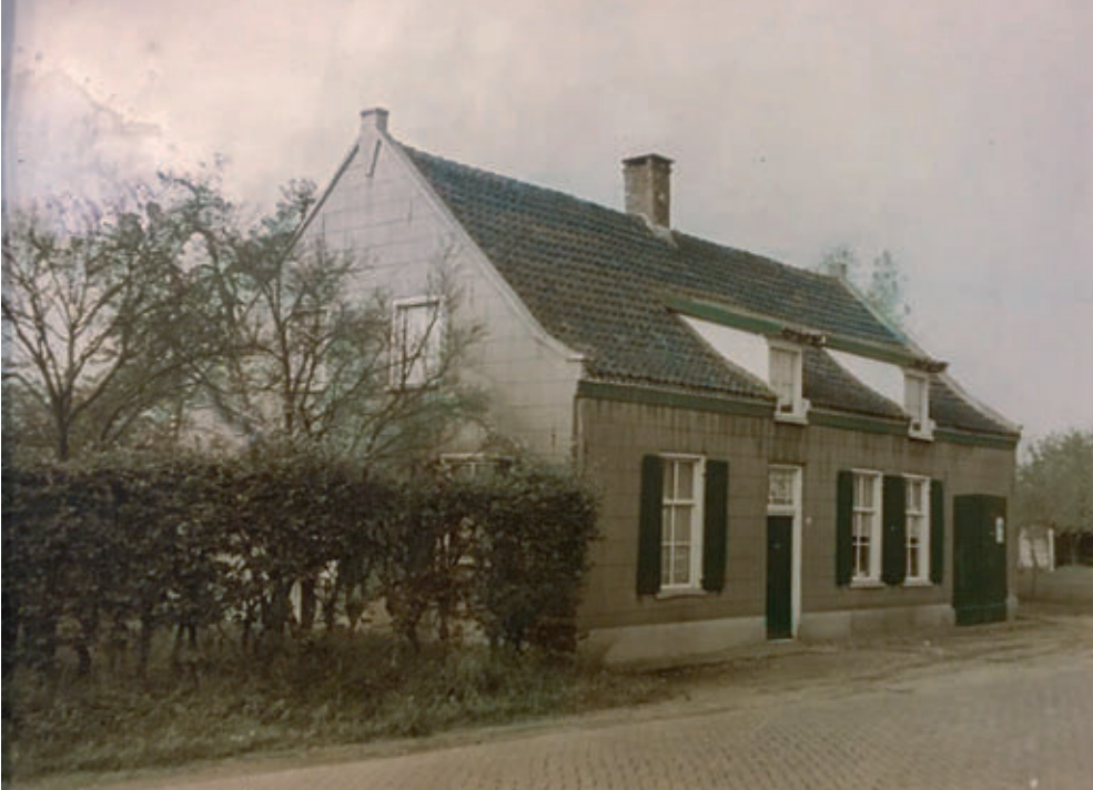
Het molenhuis aan de straatzijde. In 1967 stond het er nog.