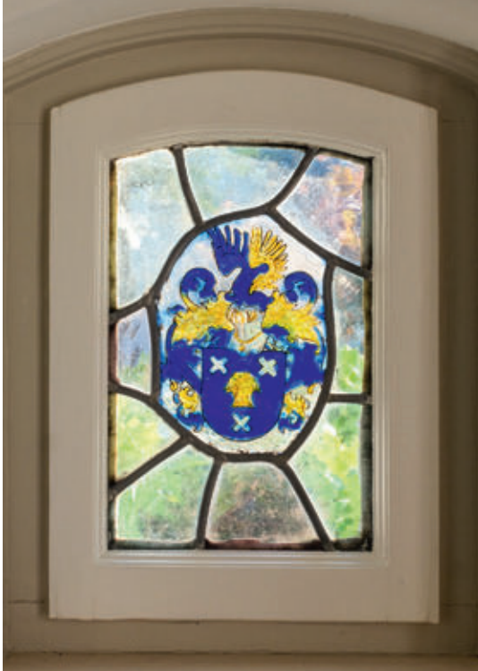
Dit raam in zijn woning 'De Berglaren' is gesigneerd door Peter Schoofs.