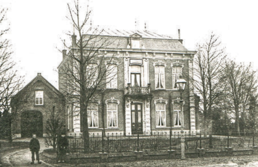
Villa Polder omstreeks 1920. Tegenwoordig is Villa Polder een rijksmonument, gelegen aan de Heuvel 4 in Gemert. Bron: Heemkundekring Gemert, beeldnummer hkk03504.

Een enkele keer haalt een ongeval waar dokter Kuijper bij geroepen wordt de krant. Zo meldt de Noord-Brabander van 13 juli 1896: “Hedenmorgen had L. v. d. Kerkhof het ongeluk uit de tweede verdieping van het in aanbouw zijnde postkantoor naar beneden te storten.