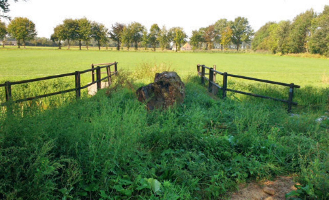
De Broekkantseweg loopt dood in een weiland voorbij de brug over de Snelleloop.

van vuursteenmateriaal uit de Middensteentijd op het terrein van De Wilde Bertram langs de Broekkantseweg. 7 Voldoende reden om ervan uit te gaan dat de weg er al in 1300 moet hebben gelegen.