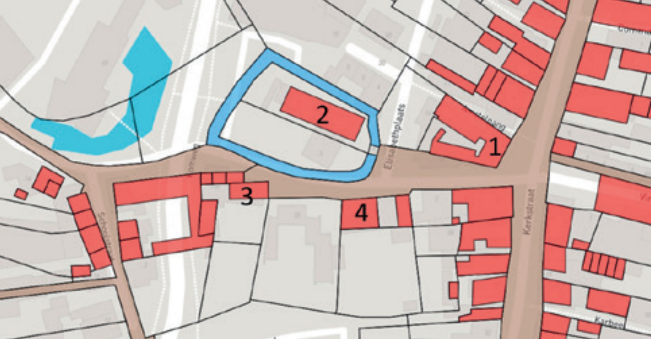
Fragment kadastraal minuutplan van 1832. Op de achtergrond is vaag de huidige situatie te zien. 1: Lekker Bijzonder, 2: Latijnse School, 3: Hofgoed, 4: D'n Hubert.

veel te herkennen. Gewapend met enige voor kennis, zoals het kadastrale minuutplan uit 1832 van deze locatie, komen we tot de onderstaande beschrijving.